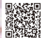
横手地域の桜の名所