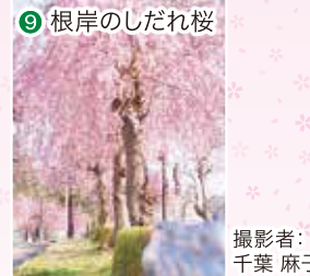
⑨ 根岸のしだれ桜