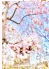
令和6年度特別賞 なっち